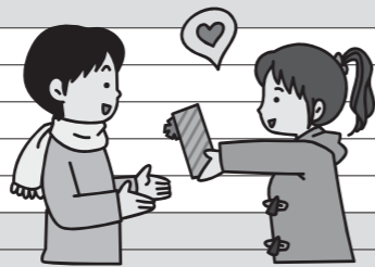
聖バレンタインデー