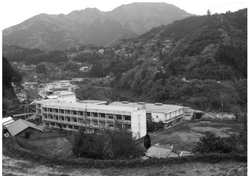
廃校となる大豊中学校

大豊中学校を廃校とすることについては、中学校に対する町民の感情も色々あると思うが、教育委員会としての対応は。