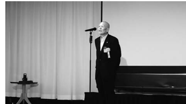
次期総会開催地からのあいさつ