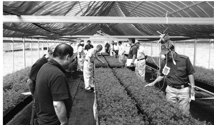
杉コンテナ苗の生産

平成27年3月に、集落活動センター「西峯」を開所し、地域住民が主体となって西峰公民館を拠点に、集落間同士の新たな活動を通じて、担い手の確保など、これからの地域の活性化に向けて集落活動の存続を目的に、集落活動センター「西峯」の産業部会において、遊休施設となっている旧西峰小中学校のグラウンドで林業用の杉コンテナ苗の生産に取り組んでいる。