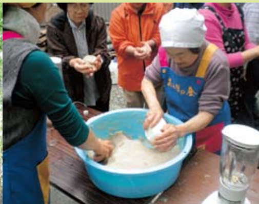
5月4日 穴内オサバイ様