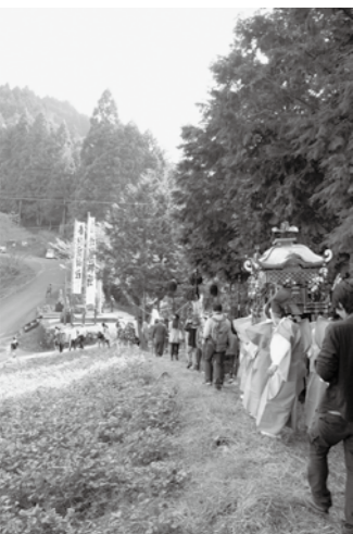
昨年の御神幸の様子