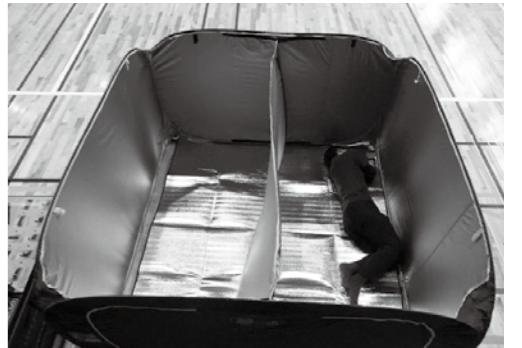
パーテーション内部 (210 × 210mm)