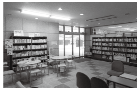
ふれあいセンター図書コーナー