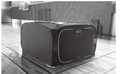
ワンタッチパーテーション