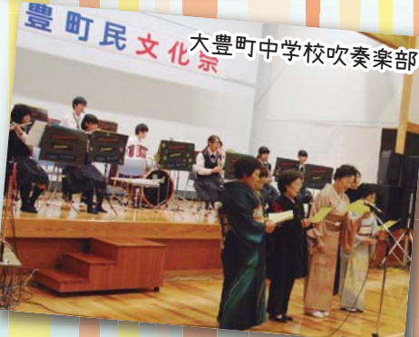
大豊町中学校吹奏楽部 豊町民文化祭