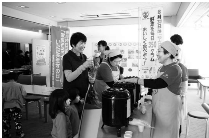
お家の味と比べてみてどうでしたか?

みそ汁の試飲調査では、塩分濃度が「薄い0.5%」「普通0.8%」「濃い1.1%」の3種類を準備し、自宅と同じと思う濃度を聞き取りしました。75人に試飲していただいた結果、5人の方が「濃い」を選びました。その方たちには、だし汁を濃くとるなど減塩の工夫を紹介し高血圧予防のために薄味を心掛けるように勧めました。