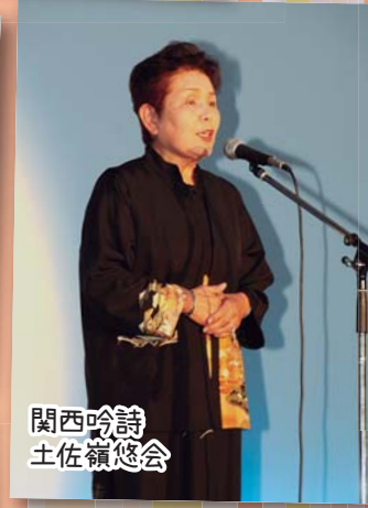
関西吟詩 土佐嶺悠会