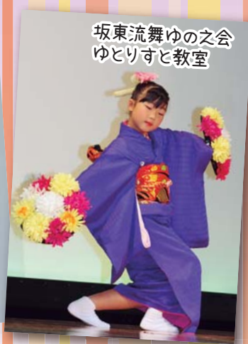
坂東流舞ゆの之会 ゆとりすと教室