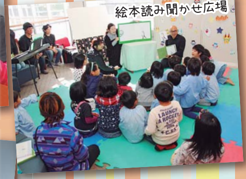
絵本読み聞かせ広場