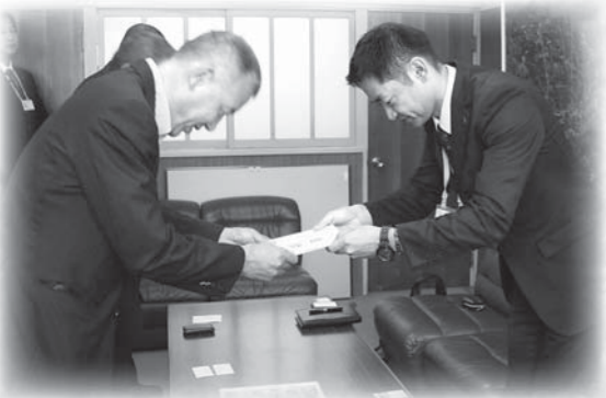
（株）セブン&アイ・ホールディングスからの 見舞金目録贈呈