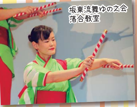
坂東流舞ゆの之会 落合教室