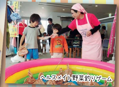
ヘルスマイト野菜釣りゲーム