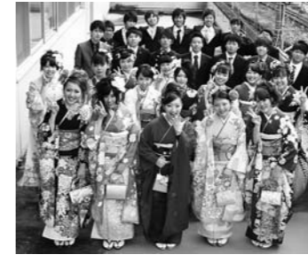
写真は平成26年の成人式の様子