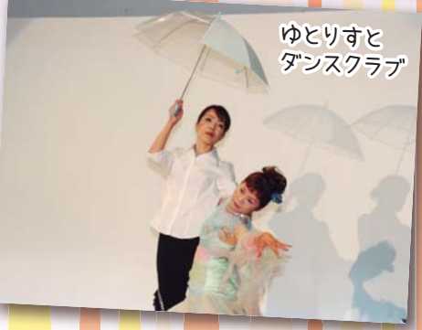
ゆとりすと ダンスクラブ