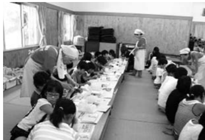
野菜を見ながら、ヘルスメイトが絵手紙の描き方を説明しています

大豊町食生活改善推進協議会では、現在59人の会員（ヘルスメイト）が、町内7地区で食育や健康的な食生活をおくるための活動をしています。