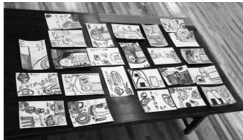
「野菜の栄養たっぷり」「朝食をしっかり食べよう」などのコメントを書きこんで、できあがり。みんな上手にできました

今回は、8月に行われた夏休み放課後子ども教室での大杉地区ヘルスメイトによる「朝ごはんをしっかり食べる」「野菜をたくさん食べる」をテーマにした絵手紙教室を紹介します。