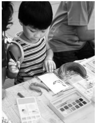
キュウリやオクラを観察しながら下書き