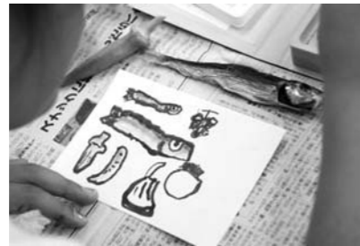
絵に色をつけます。めざしの色がうまく出せていますね