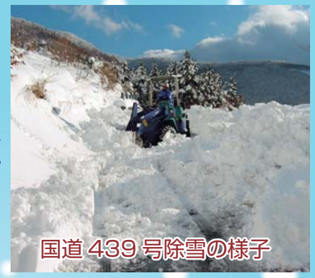
国道 439 号除雪の様子