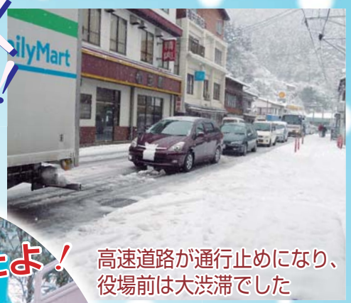
高速道路が通行止めになり、役場前は大渋滞でした