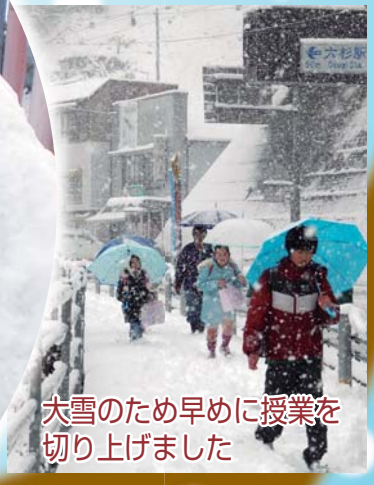
大雪のため早めに授業を切り上げました