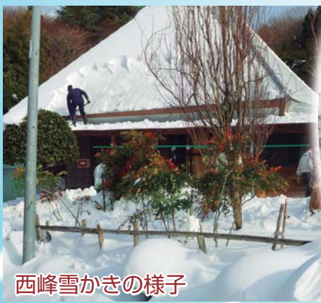
西峰雪かきの様子