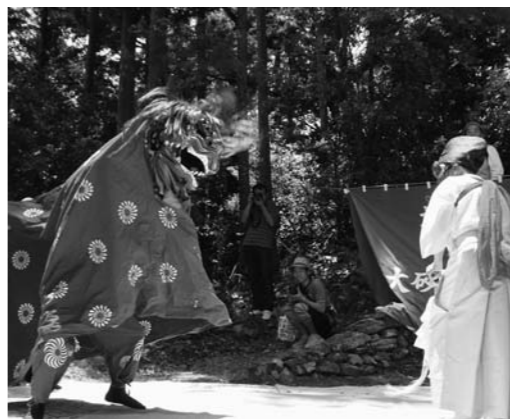
大砂子獅子舞も披露されました

で式を挙げた理由は「僕たちは現在、カフエを経営して生計を立てていますが、入籍した当初はカフエを始め「時間」と「お金」と「労力」を費やしていたので、とても結婚式を挙げる余裕はなかったのです。」 入籍前は、僕は高知と長野を歩き来する生活でしたし、彼女は岡山の大学で働いていました。2人とも、カフエを始めて生計を立てるため、まず仕事を辞め、