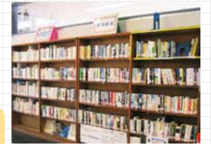
新刊図書コーナー